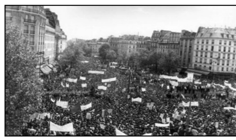
Grève en 1968