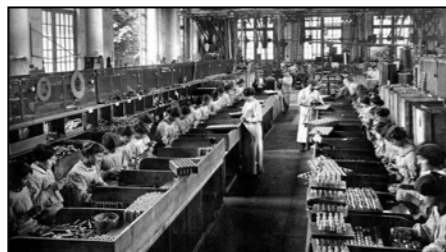
Le travail dans une usine sidérurgique en 1950