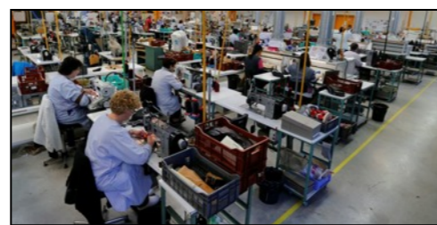
Le travail dans une usine de chaussures aujourd'hui

Que remarques-tu dans les photos de grèves?